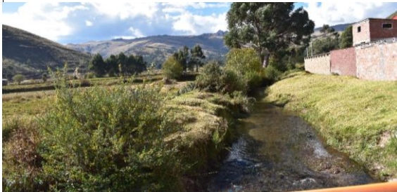
FOTO 03: Se aprecia el cauce estrangulado, así mismo se aprecia asentimiento humano y así mismo taludes naturales y afectado al pie de talud.