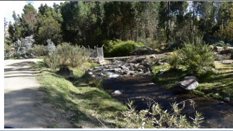
FOTO 02: Se aprecia aledaños a las riberas, trocha carrozaable San Pedro - Cuchuma.