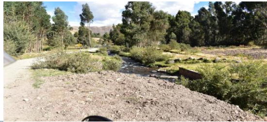
FOTO 01: Se aprecia el cauce del Rio Ccayllamayo una bocatoma, y así mismo aguas abajo con cauce colmatado y afectado las riberas en ambas margenes por erosion.